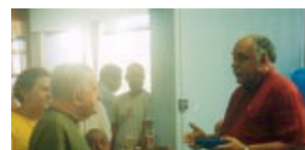
A Diretoria da APACEF, dia 24 de novembro teve a oportunidade de homenagear duas pessoas das mais queridas do seu quadro de diretores e funcionários