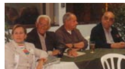
Jantar realizado em nossa sede, oferecido à Diretoria da APACEF pela empresa "Mister Cooker"