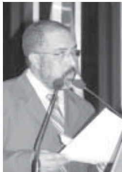
Senador Paulo Paim