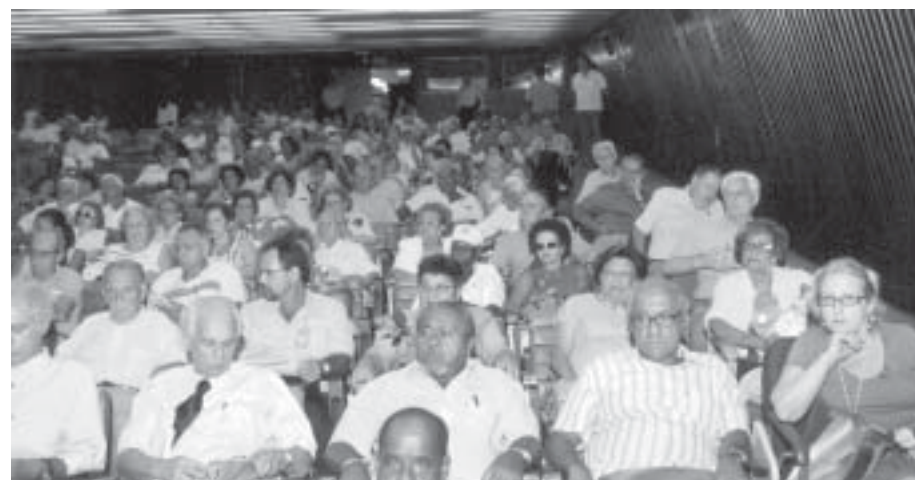
Manifestação de aposentados e pensionistas no Auditório da Caixa demonstra a mobilização da categoria

Até o fechamento desta edição, em 9 de março, O Economiário não havia tido acesso às informações sobre o resultado do encontro.