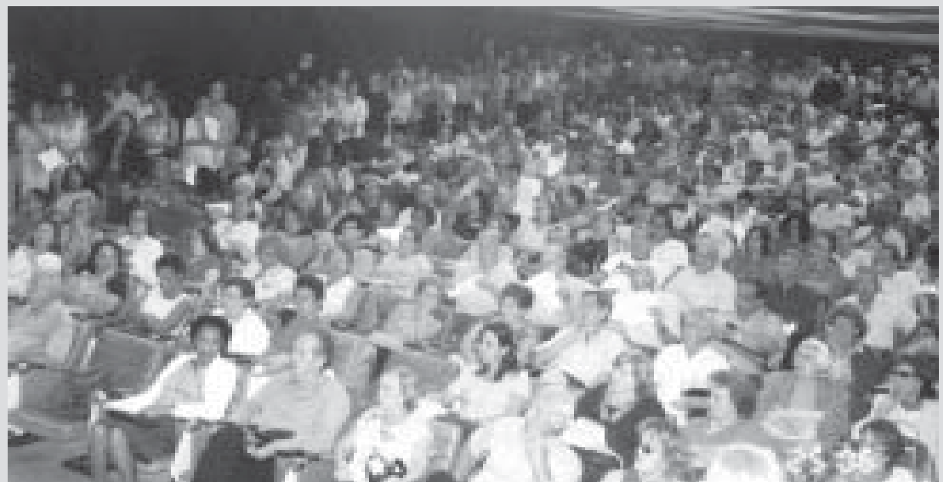
Mais de 800 pessoas lotaram as dependências do auditório da Caixa e demonstraram insatisfação com o conflito de informações

vontade política da Caixa e das lideranças que estiveram envolvidas na busca de soluções para os planos de benefícios da Funcef”. No dia 9 de agosto, a APACEF/RJ estará promovendo — em local com ampla acomodação e conforto — mais uma reunião tirando dúvidas de seus associados sobre o Novo Plano e festejando seus 26 anos de existência.