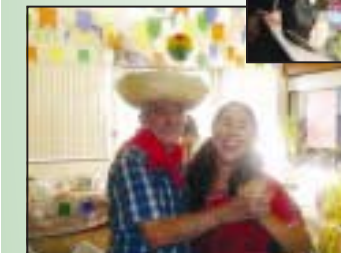
A Festa Junina empolga caipiras de todas as idades