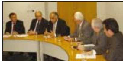
Grupo de Trabalho reúne-se para discutir proposta de Recuperação de Perda nos Proventos à Funcef

Desde 2003, durante o Simpósio de Maceió, começou uma chama que se disseminaria e chegaria ao seu ápice com a criação do Comitê de Recuperação dos Proventos e Pensões que tem representantes em todo o país. Agora todas as atenções estão voltadas para a recuperação das perdas dos proventos e pensões depois que o Conselho Deliberativo aprovou e instituiu nova redação ao parágrafo 2, no art. 115, do REG/Replan, que aprovou o pagamento de R$ 31,7%. Vale lembrar que, no documento encaminhado à Funcef, a reivindicação do Comitê era de 49%. Vamos torcer e pressionar para que a burocracia não emperre o processo de pagamento, como está acontecendo com o ex-PMPP.